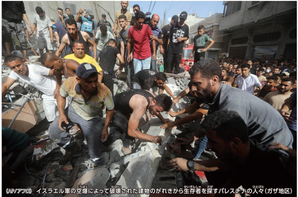
イスラエル軍の空爆によって破壊された建物のがれきから生存者を探すパレスチナの人々(ガザ地区)