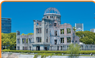
16 原爆ドーム (広島県／1996年登録) 核兵器廃絶と恒久平和のシンボル、人類の負の遺産として登録されました。