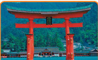
17 厳島神社 (広島県／1996年登録) 海上の建造物と弥山原始林が一体となった神社建築です。