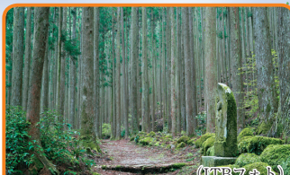
13 紀伊山地の霊場と参詣道 (和歌山県・奈良県・三重県／2004年登録) 吉野・大峰、熊野三山、高野山とその参詣道が登録されています。