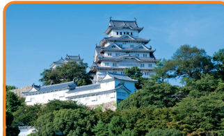
14 姫路城 (兵庫県／1993年登録) 建築技術と装飾美が木造建築の最高峰と位置付けられています。