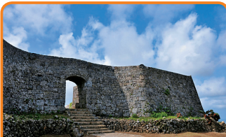
2 琉球王国のグスク及び関連遺産群 (J・S) (沖縄県／2000年登録) 沖縄で繁栄した琉球王国の城跡や史跡が点在しています。