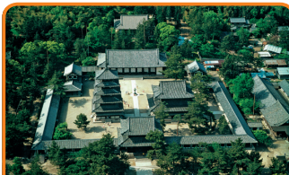
12 法隆寺地域の仏教建造物 (奈良県／1993年登録) 法隆寺は、現存する世界最古の木造建築です。