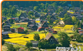
9 白川郷・五箇山の合掌造り集落 (富山県・岐阜県／1995年登録) 合掌造りの家屋が特徴ある建築物であり、その集落の自然景観が評価されました。