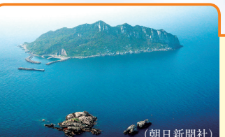
19 「神宿る島」宗像・沖ノ島と関連遺産群 (福岡県／2017年登録) 「神様が住む島」への祈りの伝統が現在まで受け継がれています。