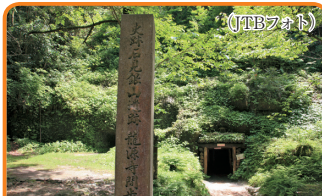
15 石見銀山遺跡とその文化的景観 (島根県／2007年登録) 400年以上世界に銀を送り出した鉱山です。周辺の文化的景観の価値も認められています。